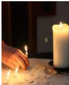
Das Licht aus Bethlehem

Die Matthias-Claudius-Gemeinde erwartet einen Tag vor Heiligabend das Friedenslicht aus Bethlehem. Am 7. Dezember wird in der Grundschule Krähenwinkel das Schul-