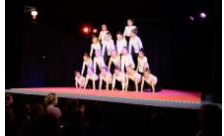
Bei den Akrobaten wurde es eng...

Akrobaten, die sich mit 18 Artistinnen auf der kleinen Bühne drängelten - und tatsächlich den Überblick behielten!