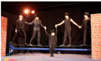
Schornsteinfeger auf dem Seil

Es war wieder ein buntes Feuerwerk, zwischen Artistik und Clownerie, das im Gemeindehaus abgefeuert wurde.