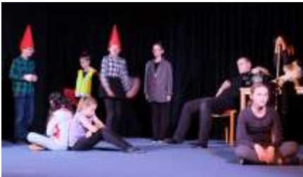
Am Anfang herrschte miese Stimmung...

Die Show trug den Titel „Hermine macht glücklich“, doch die Gestalten, die zu Beginn der Vorführung auf der Bühne saßen, machten gar keinen glücklichen Eindruck. Traurig starteten sie ins Leere.