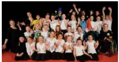
Ein tolles Team!