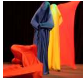
...bei den Tanzsäcken bunt.

Viel Zeit haben die Jugendlichen und Kinder in die Show gesteckt. Unterstützt und angeleitet wurden sie dabei von ihren unermüdlichen Trainern: